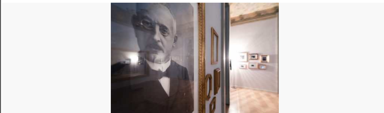
Allestimento museo Villa Bernasconi

CERNOBBIO, (Co), 24 novembre 2017-II 26 novembre 2017 una nuova e originale realtà museale apre al pubblico a Cernobbio , sul Lago di Como: si tratta del Museo di Villa Bernasconi , un gioiello Liberty fresco di restauro che ora sarà fruibile dal pubblico.