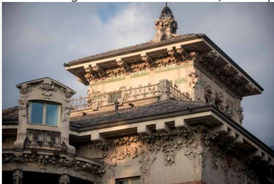
Cernobbio Villa Bernasconi allestimento mostra

Una stanza del percorso espositivo è infine dedicata al racconto dell'eredità simbolica delle Tessiture Bernasconi, attraverso le attività produttive attuali che riprendono nel contemporaneo il loro spirito imprenditoriale e che possono esporre, a rotazione, grazie al coinvolgimento di Confartigianato Settore Moda, i loro progetti più innovativi.