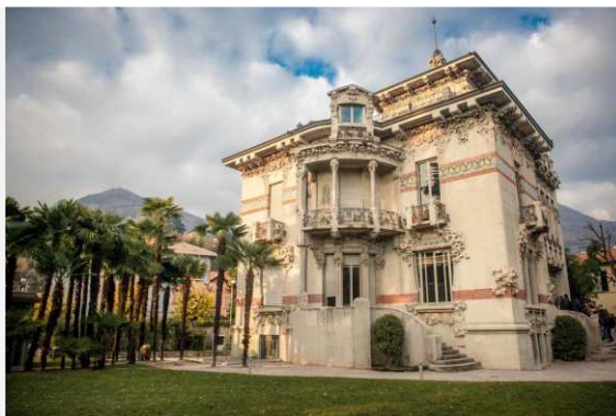
Villa Bernasconi Ph Andrea Butti_m

Cernobbio, Lago di Como: torna a splendere il gioiello liberty di Villa Bernasconi. Fresco di restauro da oggi diventerà una nuova realtà museale fruibile al pubblico. Sarà la villa stessa a raccontarsi e a condurre i visitatori lungo un itinerario alla scoperta della sua storia e delle persone che vi hanno abitato , a partire dal 1906 – anno della costruzione – ad oggi, con il supporto di soluzioni tecnologiche e di design.