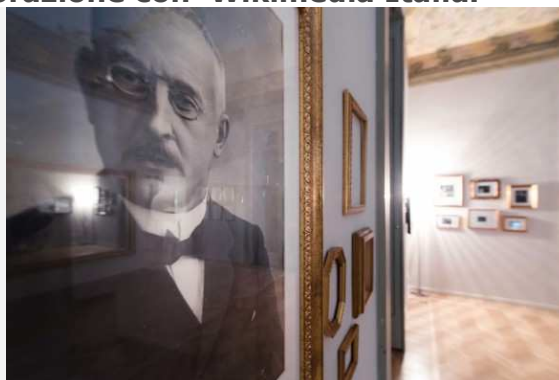
Cernobbio allestimento museo Villa Bernasconi

Quello che originariamente era l'ingresso, la stanza in cui è possibile ammirare da vicino i decori che caratterizzano Villa Bernasconi, diventa ora il luogo dedicato all'approfondimento del Liberty . Lo spazio è arredato con un salottino d'epoca in cui i visitatori potranno sedersi, rilassarsi, e – per chi è interessato ad approfondire tematiche legate all'Art Nouveau – consultare libri e multimedia. Qui è allestita anche la Wikistazione in collaborazione con Wikimedia Italia .