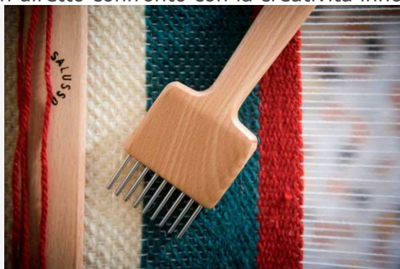
Cernobbio Villa Bernasconi allestimento mostra